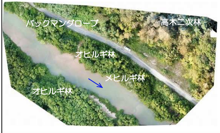
【外来植物調査の実施例】 高度 20m 撮影