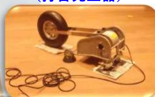
バングマシーン (打音発生器)